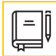
PROGRAMOVÁ PŘÍRUČKA (Č)