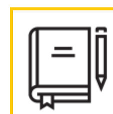
METODIKA PRO PODPORU INKLUZE