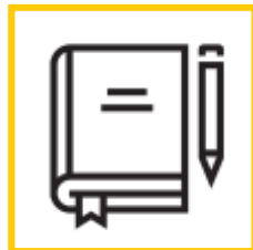
PROGRAMOVÁ PŘÍRUČKA (ENG)